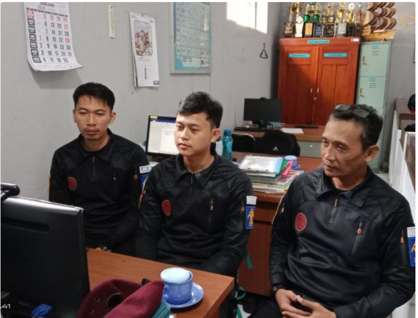
Bangun Harmoni dan Strategi, Lapas Besi Ikuti Webinar Refleksi Akhir Tahun 2024 & Resolusi 2025

CILACAP – Sebagai salah satu langkah dalam pengembangan kompetensi bagi Aparatur Sipil Negara (ASN), Petugas Lembaga Pemasyarakatan Kelas IIA Besi berpartisipasi dalam kegiatan webinar bertajuk "Refleksi Akhir Tahun 2024 dan